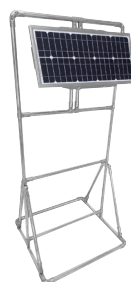
Nabíječka SolarPak (volitelná)